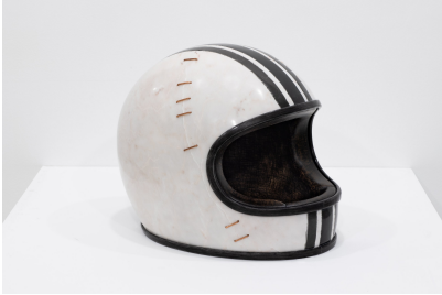
Título: A caverna Artista: Isaque Pinheiro Año: 2025 Técnica: Polychrome marble and copper Dimensiones: 42x45x53 cm Descargar