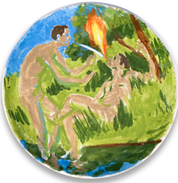
Título: Lavar pratos em família #2 Artista: Diogo Nogueira Año: 2024 Técnica: Glazed stoneware Dimensiones: 30x30 cm Descargar