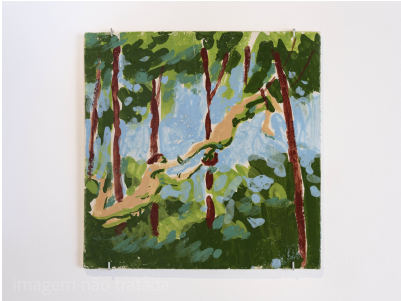
Título: Pequenas acrobacias I Artista: Diogo Nogueira Año: 2025 Técnica: Glazed ceramic Dimensiones: 40x40 cm Descargar