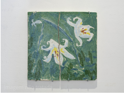
Título: Pequenas acrobacias V Artista: Diogo Nogueira Año: 2025 Técnica: Glazed ceramic Dimensiones: 40x40 cm Descargar